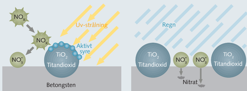
NO x -reduktionens förlopp med TiOmix®